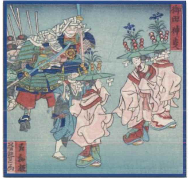
花暦浪花自慢「御田神事」